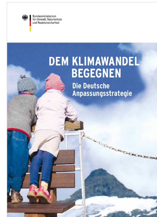
Broschüre des BMUB zur deutschen Anpassungsstrategie, Titelbild: Klaus Westermann/Caro