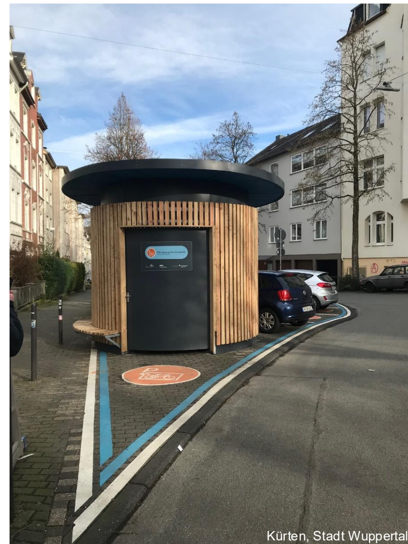
Kürten, Stadt Wuppertal