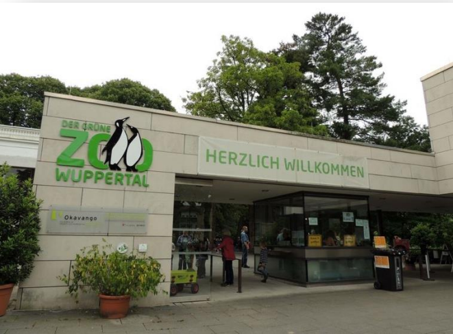
Der grüne Zoo