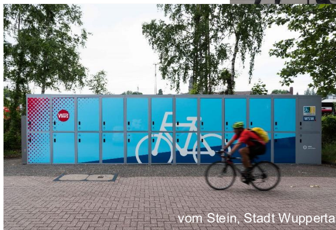
vom Stein, Stadt Wuppertal