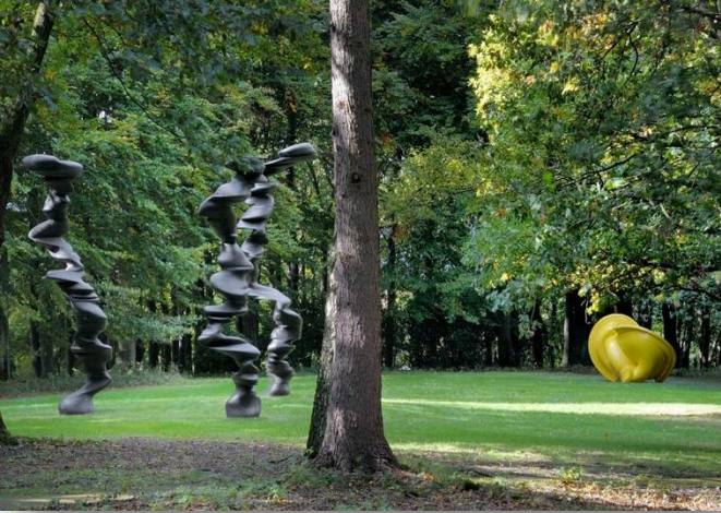
Tony Cragg Skulpturenpark