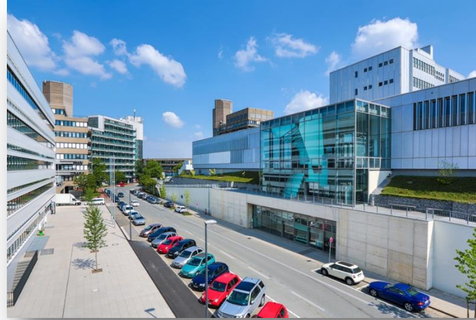
Bergische Universität Wuppertal