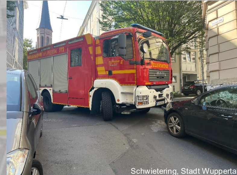
Schwietering, Stadt Wuppertal