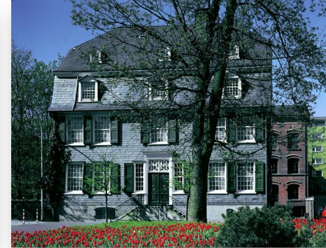
Geburtshaus Friedrich Engels