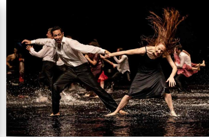
Pina Bausch Tanztheater