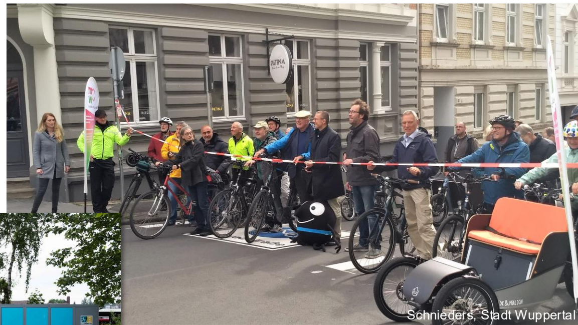
Schnieders, Stadt Wuppertal