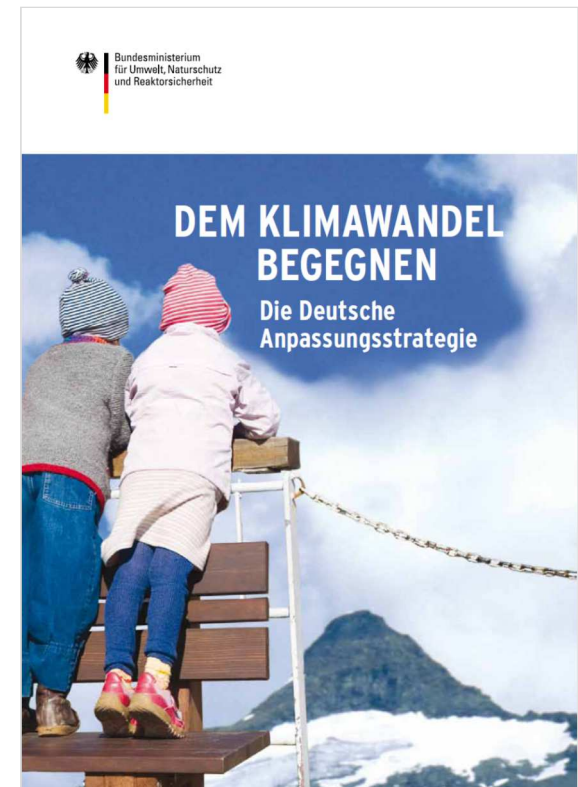
Broschüre des BMUB zur Deutschen Anpassungsstrategie, Titelbild: Klaus Westermann/Caro