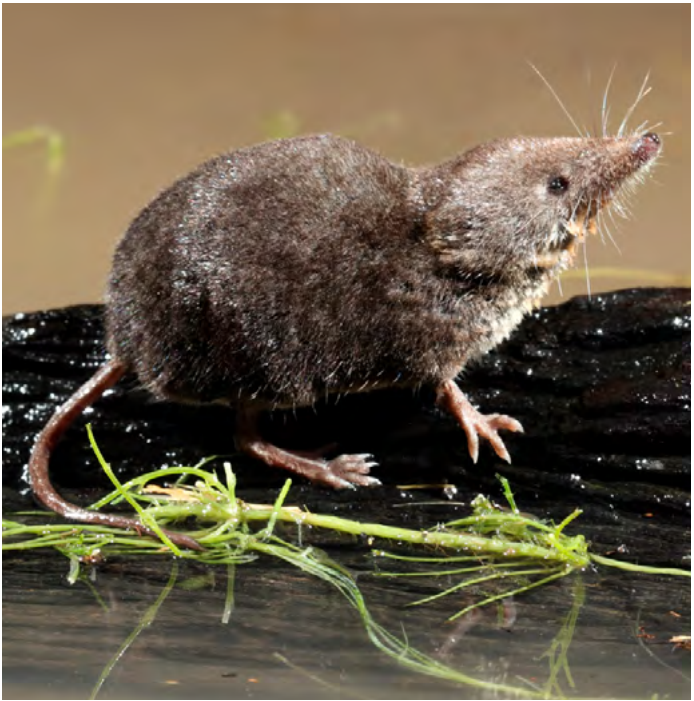
Die Wasserspitzmaus ist eines der wenigen giftigen Säugetiere Mitteleuropas.