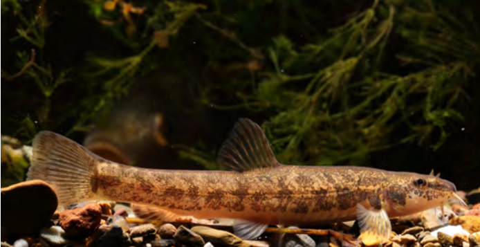
Die sechs Barteln am Maul kennzeichnen die Bachschmerle.