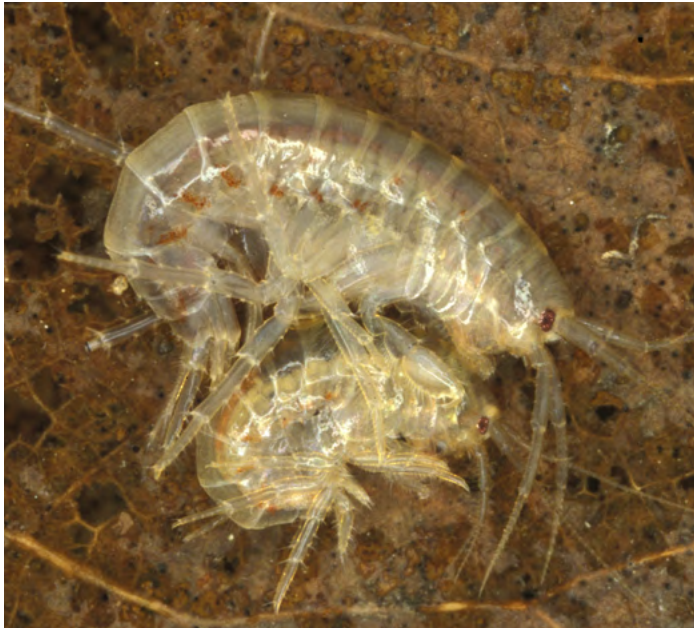
Bachflohkrebe sind eine wichtige Nahrungsgrundlage für Fische.