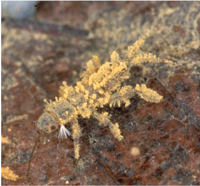
Gut getarnt ist die Larve der Steinfliege.