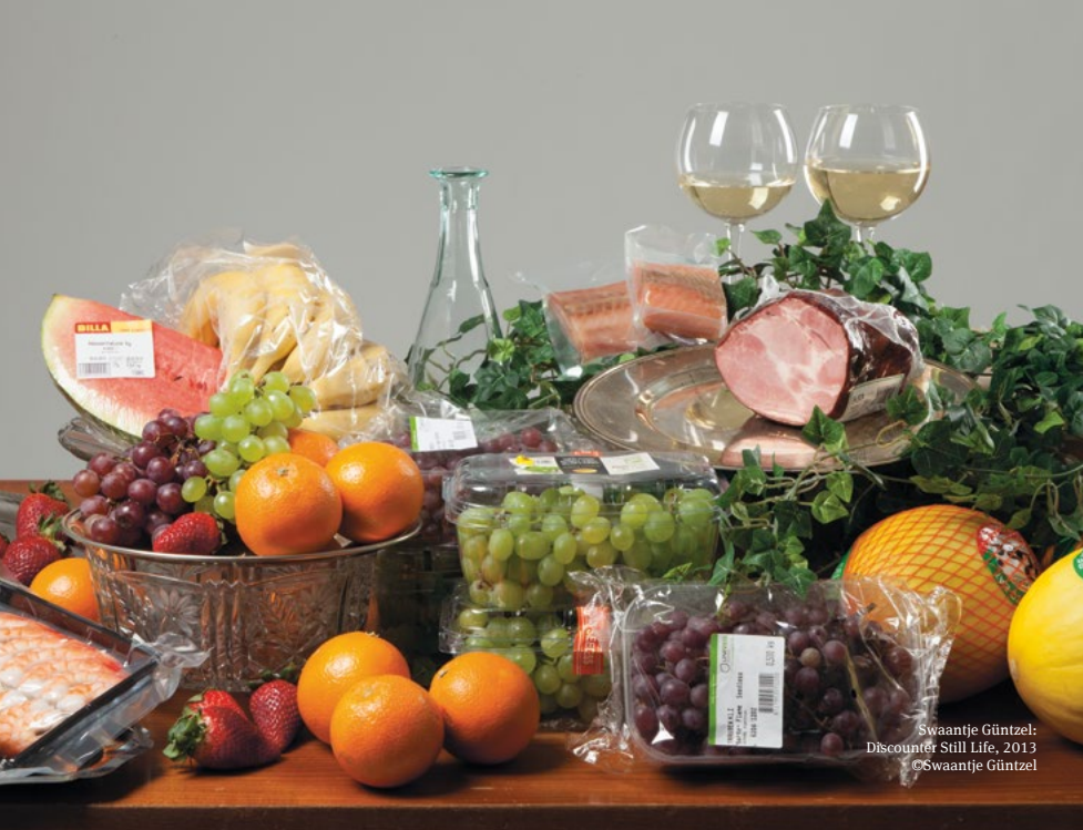
Swaantje Güntzel: Discounter Still Life, 2013 ©Swaantje Güntzel