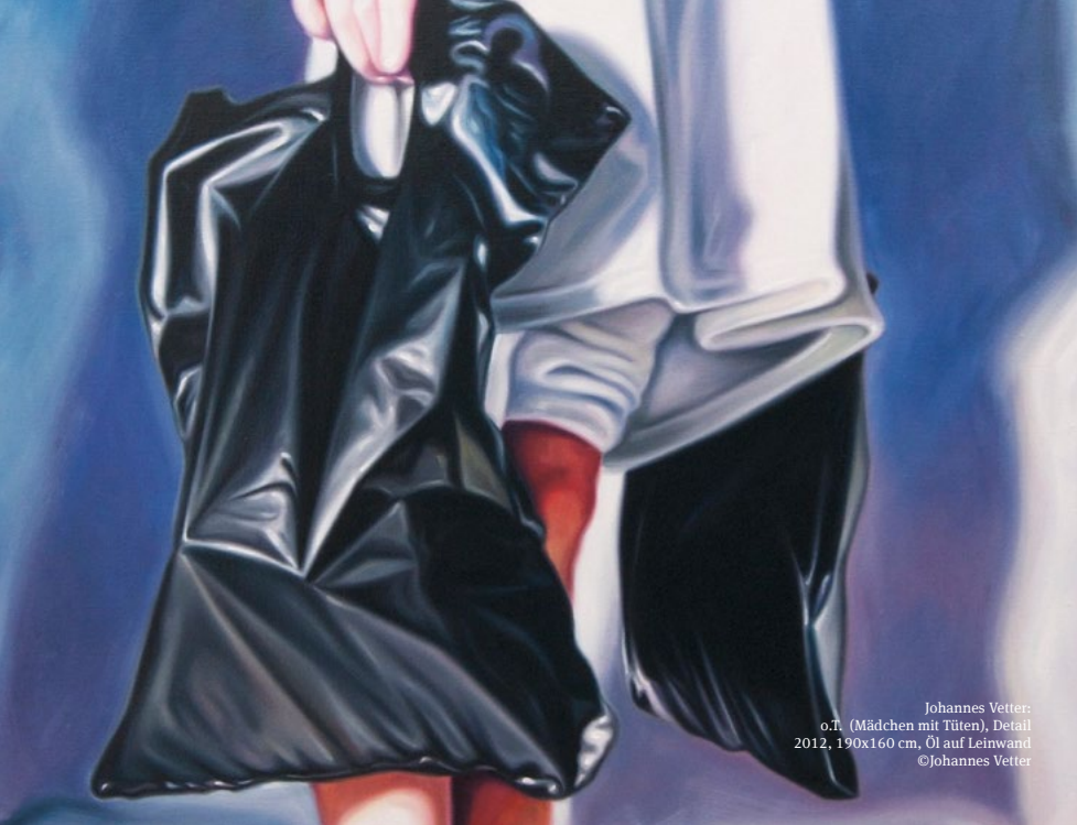
Johannes Vetter: o.T. (Mädchen mit Tüten), Detail 2012, 190x160 cm, Öl auf Leinwand ©Johannes Vetter