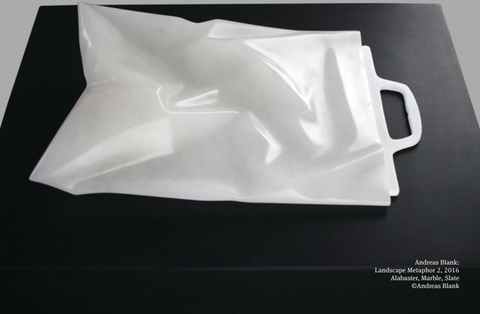
Andreas Blank: Landscape Metaphor 2, 2016 Alabaster, Marble, Slate ©Andreas Blank