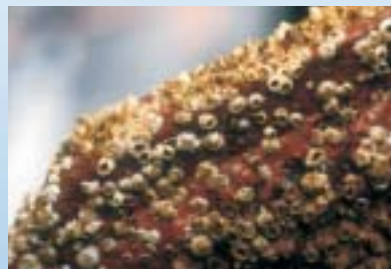
Ohne Oberflächenbehandlung wachsen Seepocken an Schiffsrümpfen zu tonnenschwerer Last heran. Die Folge: Erhöhter Treibstoffverbrauch bei gleichzeitiger Verminderung der Fahrgeschwindigkeit.

Erste Ergebnisse belegen, dass es bereits heute eine Vielzahl von Alternativen auf dem Markt gibt, die wirksam und wesentlich ungefährlicher sind als TBT, so der WWF. Dies gilt auch für sogenannte biozidfreie Antihafbeschichtungen.