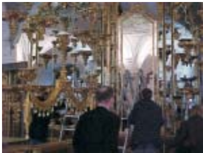
Der Pretiosensaal im Grünen Gewölbe.

Spiegel gehören zu den ältesten Gegenständen, deren Gebrauch sich nachweisen lässt. Sie waren beispielsweise allen antiken Kulturvölkern bekannt. Anfang des 18. Jahrhunderts wurden zum Veredeln des Spiegelglases überwiegend Zinn-/Quecksilbermischungen verwendet. Auch die Spiegel im Grünen Gewölbe (Dresden) sowie im Merseburger Spiegelkabinett gehören zu dieser Kategorie. Ziel des von der Spiegel Manufaktur Paderborn durchgeführten Vorhabens war es, die Umweltschäden