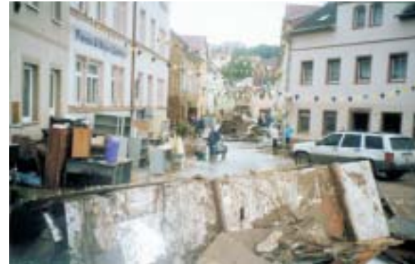
Döbeln in Sachsen wurde in der Nacht vom 12. zum 13. August 2002 von den Fluten der Freiburger Mulde überschwemmt. Präventive Maßnahmen hätten auch hier Schlimmeres möglicherweise verhüten können.

Gefördert wurde auch ein mittelständischer Betrieb der Baubranche (BIRCO Baustoffwerk GmbH/ Baden-Baden). Diese Firma hat ein neuartiges Rinnensystem entwickelt, das sich zur dezentralen Versickerung von Niederschlägen, insbesondere unter versiegelten Gewerbeflächen eignet. Ein wichtiges, zu Beginn dieses Jahres bewilligtes Vorhaben der Firma Sydro Consult GbR (Darmstadt) befasst sich mit dem Wasser- und Stoffstrommanage-