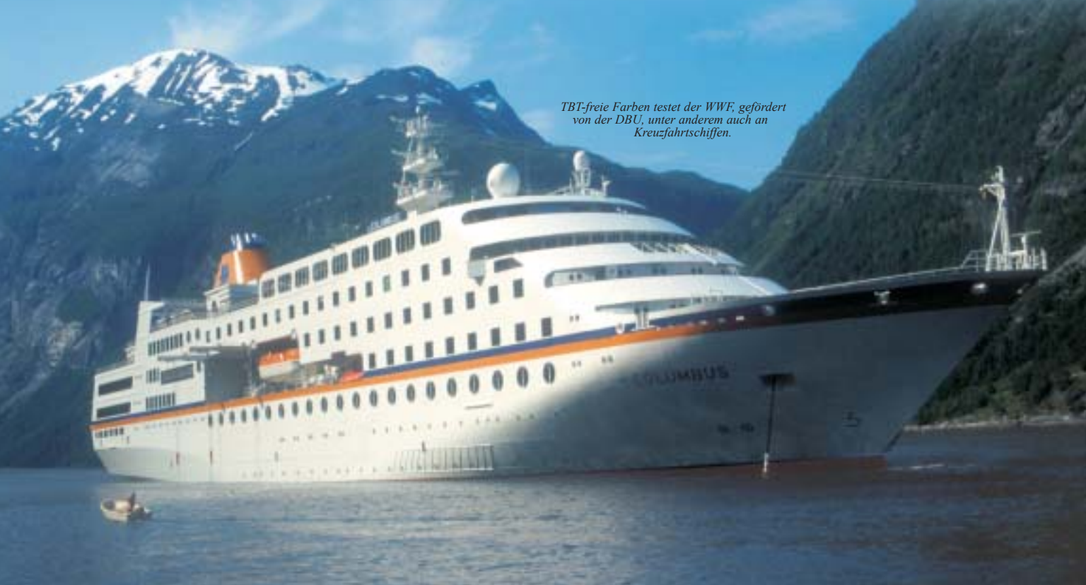
TBT-freie Farben testet der WWF, gefördert von der DBU, unter anderem auch an Kreuzfahrtschiffen.

Im Rahmen des Ostseeschwerpunkts fördert die DBU daher eine Promotionsarbeit zu den Haftmechanismen von Seepocken, die am Labor Limnomar (Hamburg) durchgeführt und vom Zoologischen Institut und Museum Greifswald betreut wird. Die Ergebnisse dieser Arbeit werden ebenfalls auf der SMM vorgestellt.