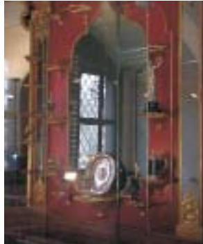
Das Emaillenzimmer im Grünen Gewölbe in Dresden.

Eine chemische Untersuchung der Korrosionsvorgänge zeigte allerdings, dass es sich bei all diesen Schäden um ein und denselben Prozess handelt, nämlich die Oxidation des