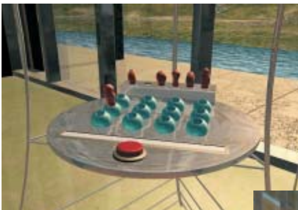
Ein Biosensor-Steckmodell lädt zum Anfassen und Ausprobieren ein.

Wollfasern so verändern, dass sie weich und leicht anfärbbar sind und wie Mikroorganismen Schwermetalle aus dem Sediment lösen. Bierbrauern in den Kessel zu schauen, Essigmeistern über die Schulter zu