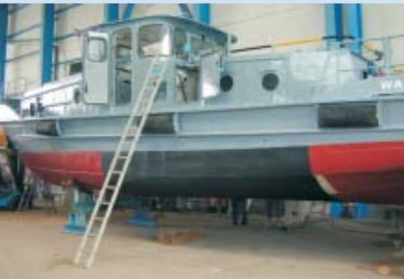
Auf verschiedenen Flächen des Schiffsrumpfes werden unterschiedliche umweltverträgliche Antifoulinganstriche getestet.

Diese neue Antihafbeschichtung baut auf das Prinzip der niedrigen Oberflächenenergie. Fluoradditive, die handelsüblichen Lacken zugesetzt werden, verändern die physikalischen Eigenschaften der Oberfläche und erzeugen extrem niedrige Oberflächenenergie.