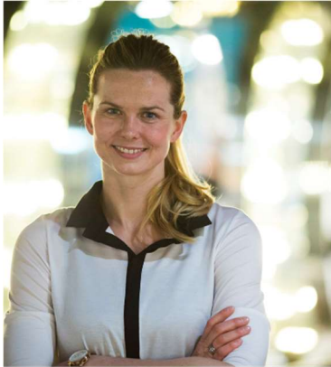
Britta Steffen Sportlerin, Moderatorin

Britta Steffen nahm bereits im Jahr 2000 zum ersten Mal an den Olympischen Spielen teil. 2004 begann sie ihr Studium Wirtschaftsingenieurwesen für Umwelt und Nachhaltigkeit in Berlin.