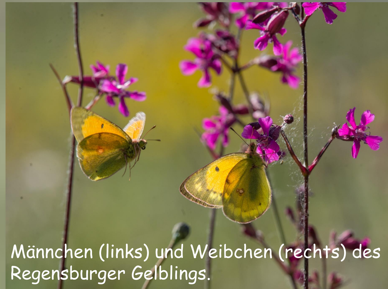
Männchen (links) und Weibchen (rechts) des Regensburger Gelblings.

Eine große Besonderheit in dieser Kulturlandschaft ist der Regensburger Gelbling ( Colias myrmidone ) , der in vielen Regionen Europas mittlerweile ausgestorben ist (Karte rechts unten).