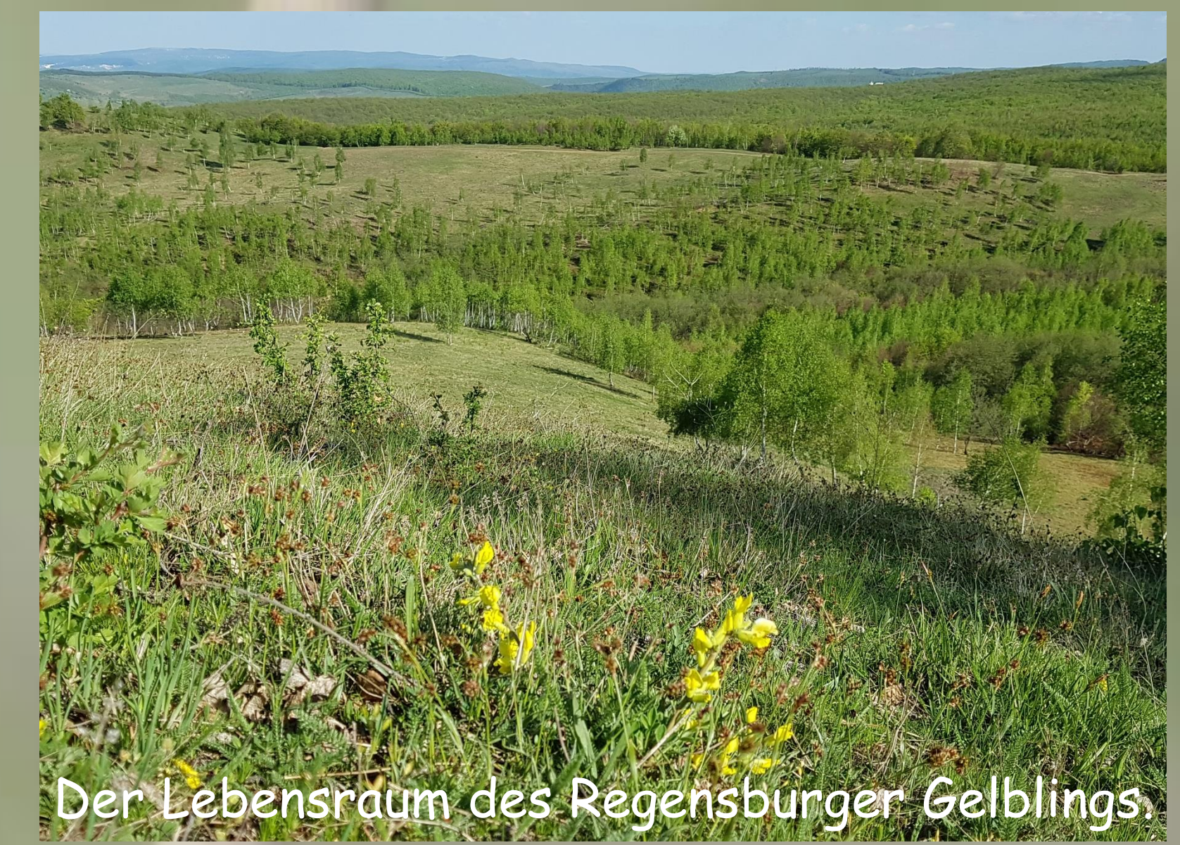
Der Lebensraum des Regensburger Gelblings.

Bis heute kam diese Schmetterlingsart gut mit der traditionellen Landwirtschaft zurecht: Die hiesigen Bauern mähten oder beweideten ihre Wiesen kleinräumig unterschiedlich und extensiv. Dadurch entwickelte sich die eingangs beschriebene breite Übergangszone zwischen Wiese und Wald, welche inzwischen vielerorts durch landwirtschaftliche Intensivierung verloren geht. Aufforstungen und eine zu intensive Nutzung der Wiesen mit Düngung, zu häufiger und großflächiger Mahd oder zu vielen Weidetieren verdrängen nicht nur den Zwergginster, sondern damit auch den Regensburger Gelbling. Wichtig für den Schutz dieser Schmetterlingsart ist somit der Erhalt einer geeigneten Kulturlandschaft, welche eine ausreichende Strukturvielfalt gewährleistet . Eine Lösung ist, mosaikartig immer nur einen kleinen Teil der Wiesen zu beweiden . Dort, wo die Weidetiere gerade nicht sind, können sich die Raupen ungestört bis zum Falter weiterentwickeln.