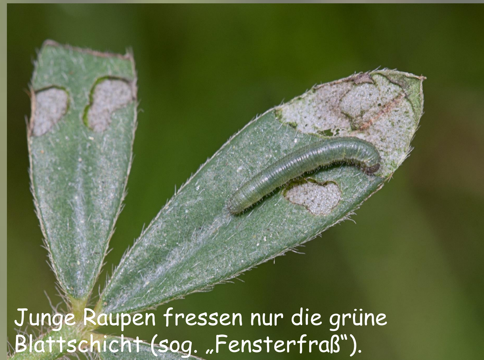
Junge Raupen fressen nur die grüne Blattschicht (sog. „Fensterfraß“).

Die Fotos auf dieser Infotafel zeigen diesen prächtigen und flugkräftigen Schmetterling. Allerdings kommt er auch in Transsilvanien nur noch in eng begrenzten Gebieten vor, welche seinen besonderen Ansprüchen genügen. Aufgrund der sich verändernden und zunehmend intensivierten Nutzung der Wiesen ist dieser Schmetterling auch hier gefährdet.