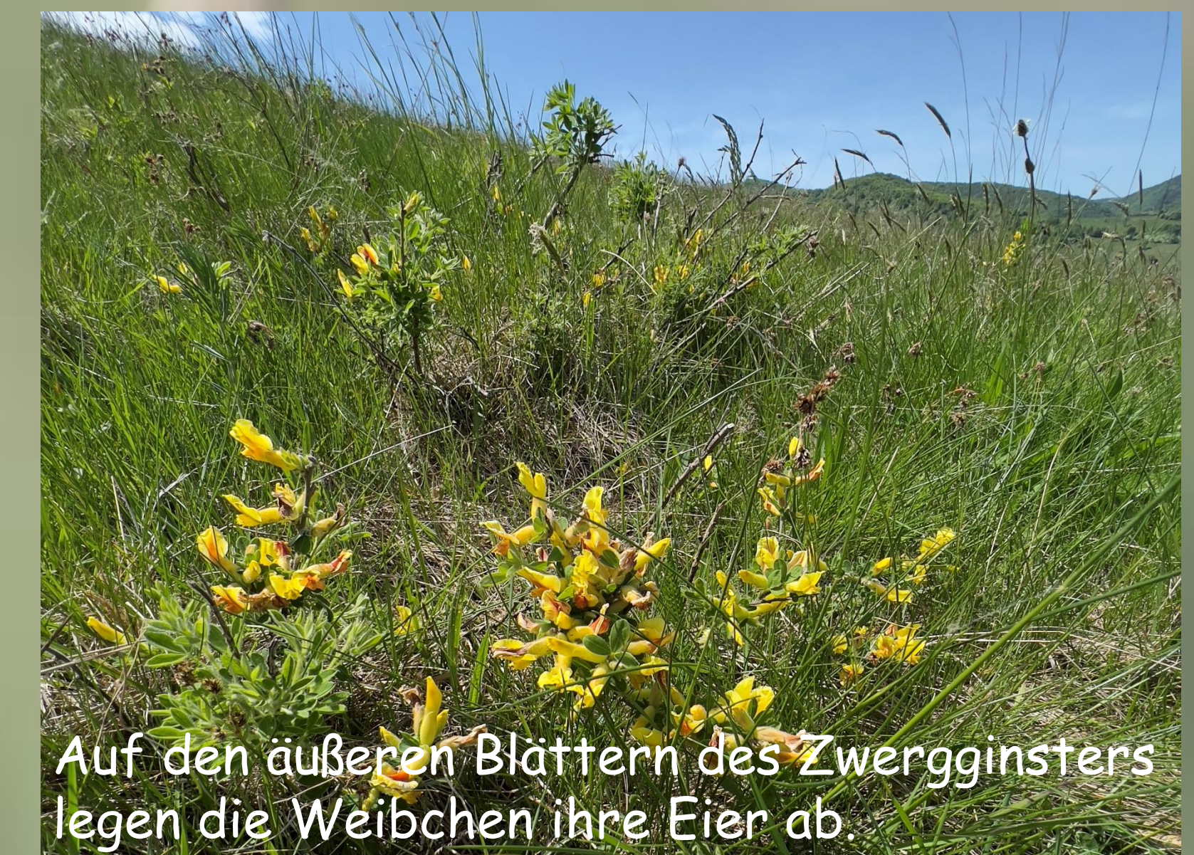
Auf den äußeren Blättern des Zwergginsters legen die Weibchen ihre Eier ab.