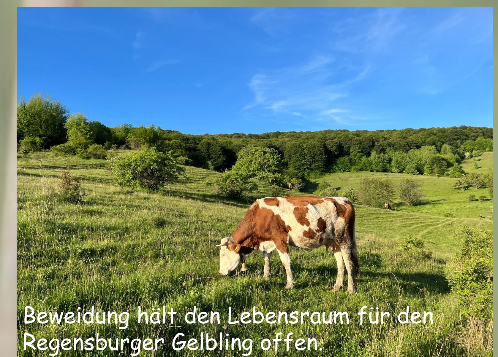
Beweidung hält den Lebensraum für den Regensburger Gelbling offen.